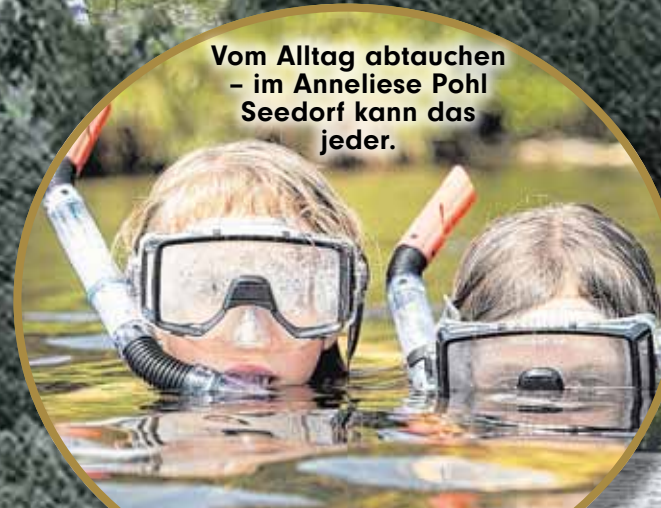
Vom Alltag abtauchen - im Anneliese Pohl Seedorf kann das jeder.