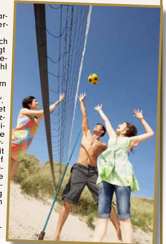
Im Anneliese Pohl Seedorf gibt es jede Menge Freizeitangebote.