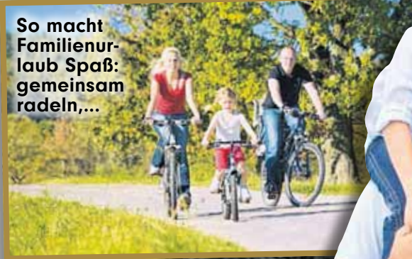
So macht Familienurlaub Spaß: gemeinsam radeln....