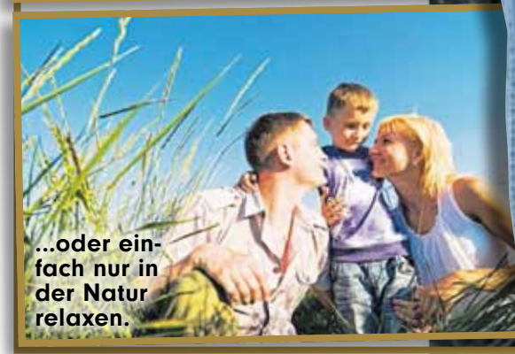
...oder einfach nur in der Natur relaxen.