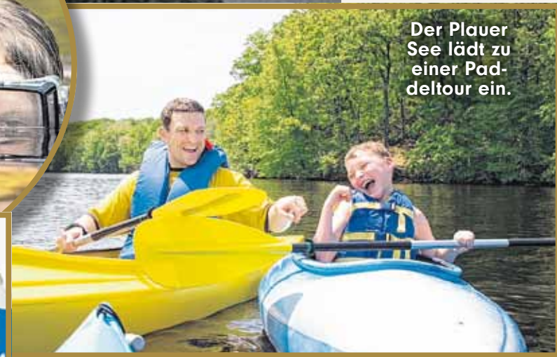
Der Plauer See lädt zu einer Paddeltour ein.